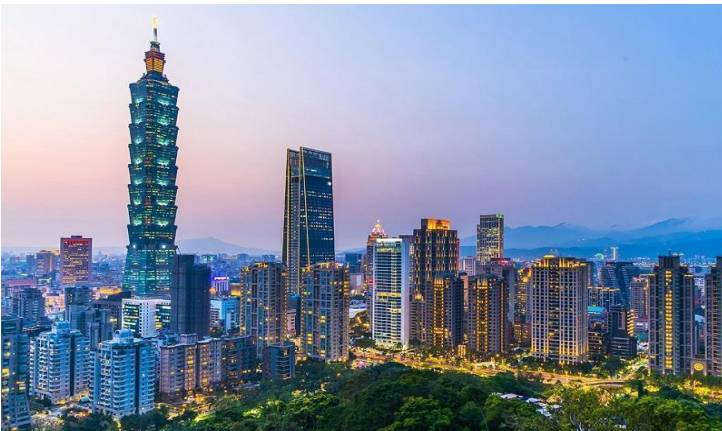
Tháp Taipei 101 - Niềm kiêu hãnh của Châu Á