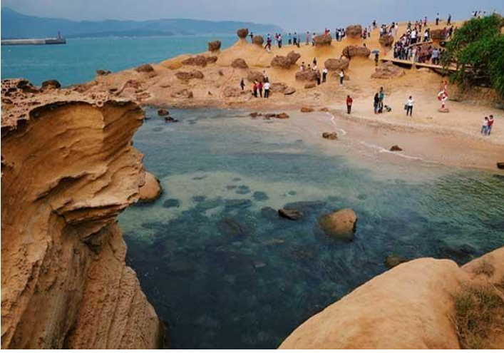
Đắm mình vào mùa hè trên Công viên Dã Liễu