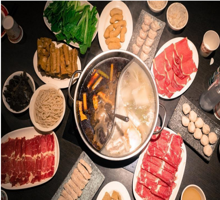
(Buffet lẩu Shabu Shabu)