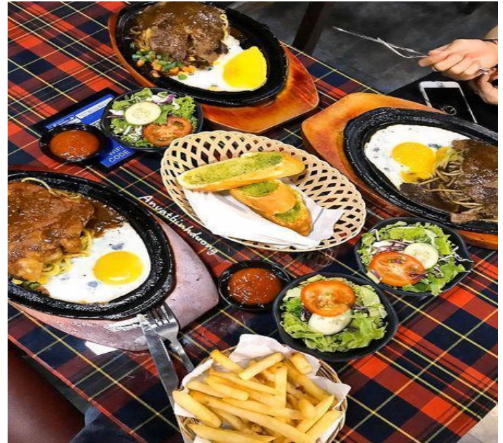
(Bò beefsteak chuẩn Đài Loan)