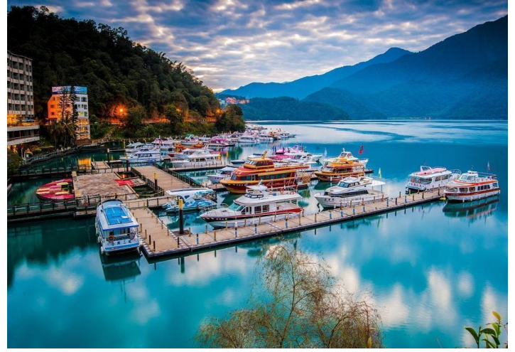
Ngồi du thuyền dạo quanh Hồ Nhật Nguyệt Đàm